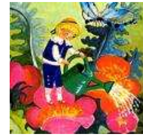
Tistou les pouces verts

10h30 à 11 h30 à salle polyvalente de l'école primaire de BEAUMONT du Périgord.